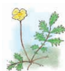
Eskimomure Potentilla egedii

The northernmost part of the reserve is used in summertime for swimming, walking and horseback riding. In the wintertime, there is a ski trail in the area. There are trails, tables and benches placed in the area for recreational use.