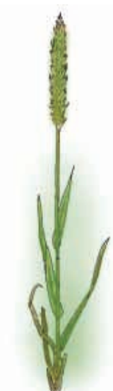
Strandrug Elymus arenarius