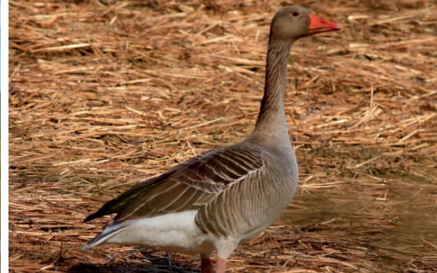
Grågås/Greylag Goose.