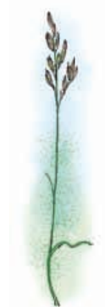
Raudsvingel Festuca rubra