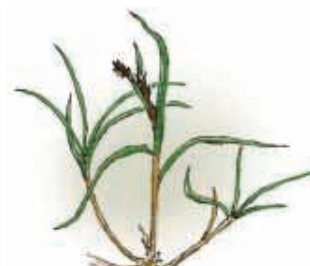
Ishavsstarr Carex subspathacea