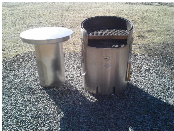
Figur 2 Ny grill