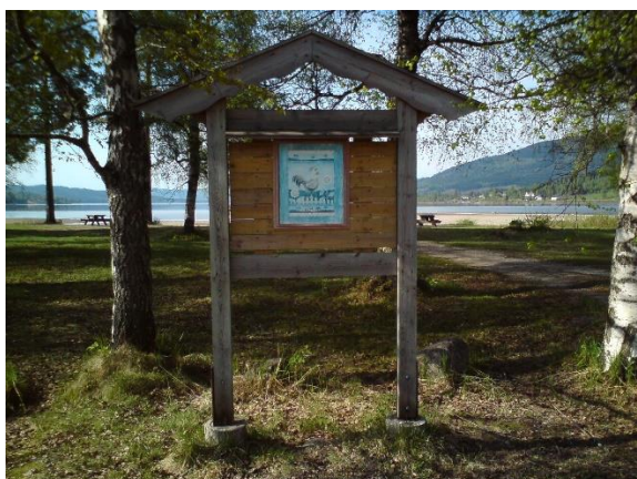
Figur 3, Infotavle(gammel?)