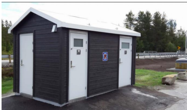
Figur 1. Nye toaletter