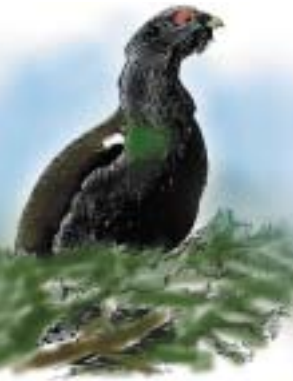
Storfugl Tetrao urogallus

Stabbursdalen nasjonalpark ble opprinnelig opprettet i 1970. I 2002 ble nasjonalparken utvidet fra 96 km 2 til 747 km 2 , samtidig som det tilgrensende Stabbursdalen landskapsvernområde (189 km 2 ) ble etablert. Verneområdene er opprettet for å bevare et særprega og vakkert dalføre med verdens nordligste furuskog, og for å bevare et storslått og variert ødemarksområde som er rikt på spor fra isavsmeltinga ved slutten av siste istid. Nasjonalparken og landskapsvernområdet inneholder et variert utsnitt av mange av Finnmarks typiske landformer: karrig høgfjell, vidde, elvegjel, fjellbjørkeskog og lune dalfører med furumoer.