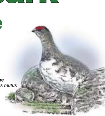
Fjellrype Lagopus mutus

Stabbursdalen nasjonalpark ble opprinnelig opprettet i 1970. I 2002 ble nasjonalparken utvidet fra 96 km 2 til 747 km 2 , samtidig som det tilgrensende Stabbursdalen landskapsvernområde (189 km 2 ) ble etablert. Verneområdene er opprettet for å bevare et særprega og vakkert dalføre med verdens nordligste furuskog, og for å bevare et storslått og variert ødemarksområde som er rikt på spor fra isavsmeltinga ved slutten av siste istid. Nasjonalparken og landskapsvernområdet inneholder et variert utsnitt av mange av Finnmarks typiske landformer: karrig høgfjell, vidde, elvegjel, fjellbjørkeskog og lune dalfører med furumoer.