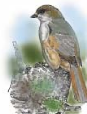
Lavskrike Perisoreus infaustus