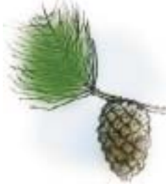
Furu Pinus silvestris