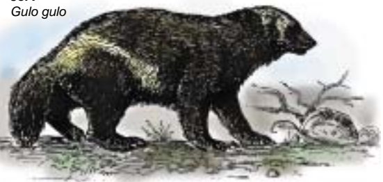
Jerv Gulo gulo

Det har antakelig vært menneskelig virksomhet i området allerede fra steinalderen. Fram til 1600-tallet ble det drevet villreinfangst i Stabbursdalen, noe funn av fangstgroper og lagringsgroper vitner om. Det finnes også spor etter samiske boplasser i form av gammetufter og spor etter teltplasser. Stabbursdalens naturressurser har vært en viktig del av næringsgrunnlaget for den sjøsamiske befolkningen. Her er lange tradisjoner for jakt og fiske så vel som førsanking. Starrbeltene i Lompola ble for i tida slått til vinterfôr, og gamle stubber i furuskogen vitner om tidligere hogst til båt- og husbygging.