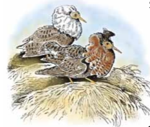
Brushane Ruff ( Philomachus pugnax )

Rangers: Norwegian State Nature Inspectorate, Vadsø.