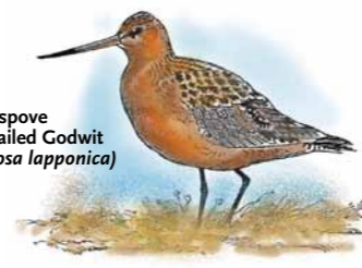
Lappspove Bar-tailed Godwit ( Limosa lapponica )