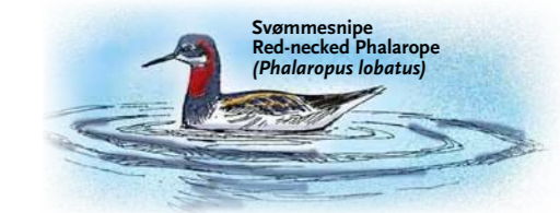
Svømmesnipe Red-necked Phalarope ( Phalaropus lobatus )

At the cape south of the church there is found prehistoric graves and a sacrificial stone from earlier Sami religious exercises. The first church was moved here in 1747 from Angsnes, at the southern side of the fjord. The current church was built in 1858, and is one of few churches in Finnmark that was not burnt when the Germans retreated in the fall of 1944 (World War II).