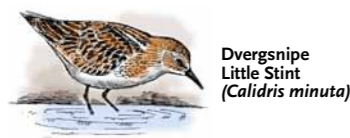
Dvergsnipe Little Stint ( Calidris minuta )

I alt er det registrert 22 arter av vadefugl i reservatet. De mest tallrike er sandlo ( Charadrius hiaticula ), myrsnipe ( Calidris alpina ), dvergsnipe ( C. minuta ), tundrasnipe ( C. ferruginea ), polarsnipe ( C. canutus ), brushane ( Philomachus pugnax ) og lappspove ( Limosa lapponica ).