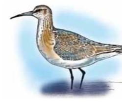
Tundrasnipe Curlew Sandpiper ( Calidris ferruginea )