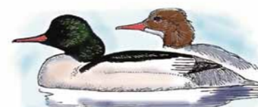
Laksand/Goosander ( Mergus merganser )