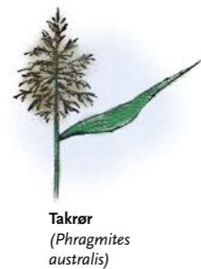
Takrør ( Phragmites australis )

Langs hele fuglefredningsområdet er det et bredt belte av vann- og vannkantvegetasjon med stor variasjon. Dominerende plantearter er takrør, sjøsvaks, elvesnelle, hjerte-tjønna, hvit nøkkerose og gulldusk. Verneområdet grenser til dyrkamark i øst og til veg og barskog i sør.