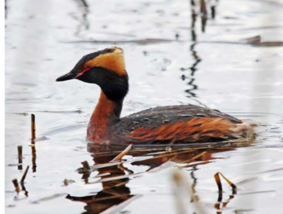
Horndykker ( Podiceps auritus )