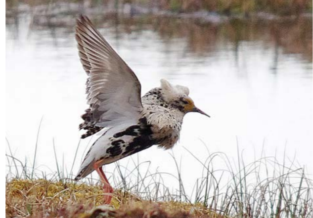
Brushane ( APhilomachus pugnax ). Midten: Krikkand ( Anas crecca )