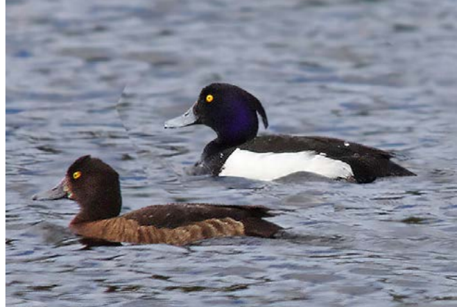
Toppand ( Aythya fuligula )