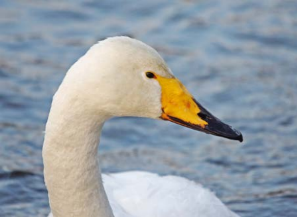
Sangsvane ( Cygnus cygnusa )