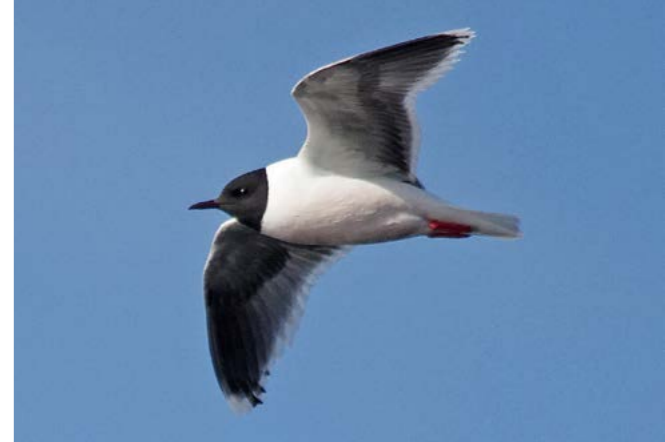
Dvergmåke ( Larus minutus )