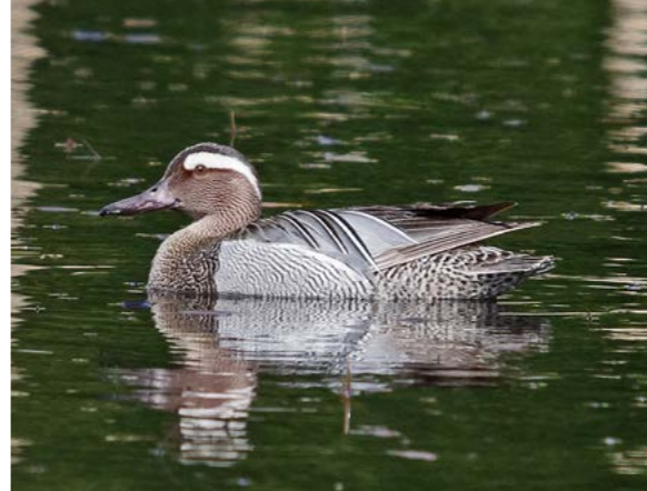
Knekkand ( Anas querquedula )