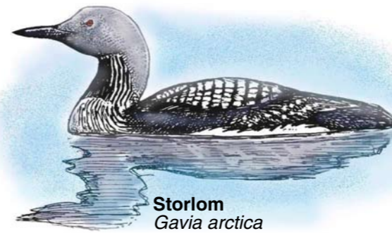
Storlom Gavia arctica