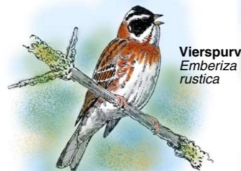
Vierspurv Emberiza rustica

Våtmarkene er av de mest truede naturtypene vi har. De er utsatt for en rekke forskjellige inngrep som f.eks. gjenfylling, neddemming, drenering og søppelfylling.