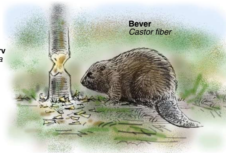
Bever Castor fiber