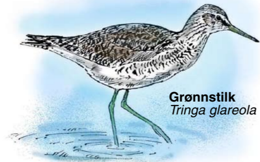
Grønnstilk Tringa glareola