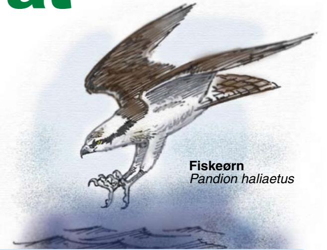
Fiskeørn Pandion haliaetus

Ulendeltaet naturreservat i Lierne kommune ble opprettet den 14. desember 1984. Naturreservatet dekker et areal på ca. 2,8 km 2 , hvorav ca. 2,0 km 2 er landareal.