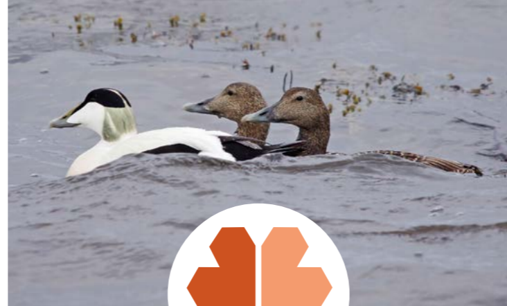
Ærfugl ( Somateria mollissima )