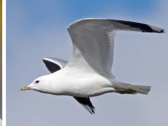
Fiskemåke ( Larus canus ). Rambergholmen er også en god hekkelokalitet for fiskemåke og hettemåke.