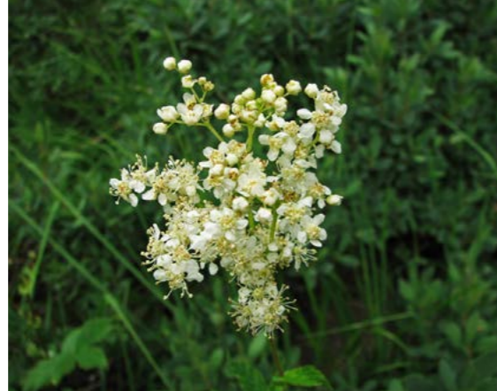
Mjødurt ( Filipendula ulmaria )