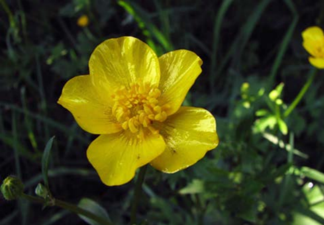
Bekkeblom ( Caltha palustris ). Vanlige planter på Rambergholmen er bla. mjødurt og bekkeblom.