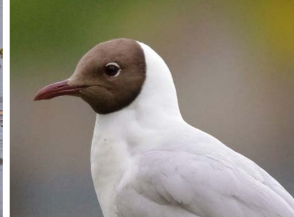
Hettemåke ( Larus ridibundus )