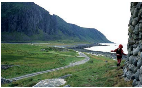
Eggum naturreservat sett fra Kvalhausen.