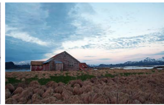
Gammel bebyggelse i Borgværet landskapsvernområde.