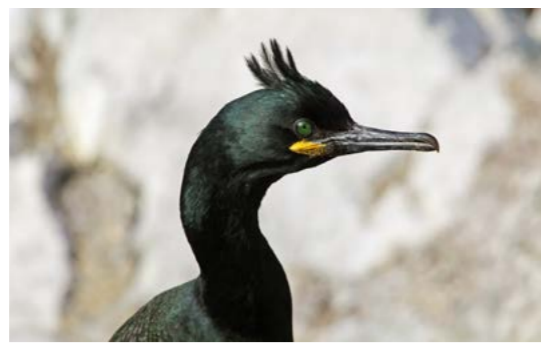
Topptskarv. Midten: Ærfugl.