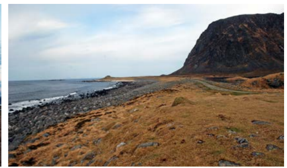
Randmorene med rullesteinsstrand i Eggum naturreservat.