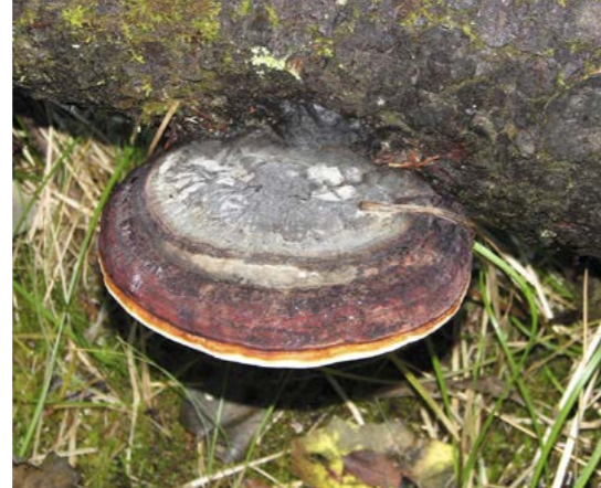
Rødrandkjuke ( Fomitopsis pinicola ). Av vedboende sopper finnes vanlige arter som rødrandkjuke, folkjuke, hyllekjuke og tjærekjuke. Midten: Øverengmoen naturreservat.