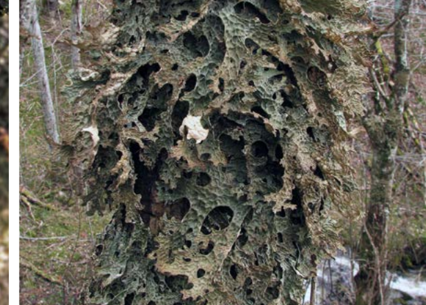
Lungenever ( Lobaria pulmonaria ). Reservatet en godt utviklet flora av bladlaver tilhørende lungenever-samfunn på grankvist. Både lungenever, skrubbenever, grynvrønge og glattvrønge forekommer i store mengder på gran.