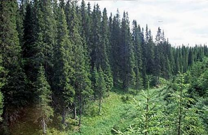
Øverengmoen naturreservat.