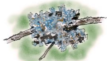
Fossenever ( Lobaria hallii ). En spesiell og karakteristisk regnskogsart er rødlistearten fossenever som finnes til dels rikelig på en håndfull vierbusker.

I Øverengmoen naturreservat finnes innslag av en skogstype som i Europa bare finnes i Midt-Norge, nemlig boreal regnskog. Tilsvarende skoger finnes ellers bare noen få steder ellers i verden. Typisk for den boreale regnskogen er at den pga. mye nedbør og relativt mildt klima har et fuktig og frodig livsmiljø. Den kan derfor på mange måter kalles Europas regnskog!