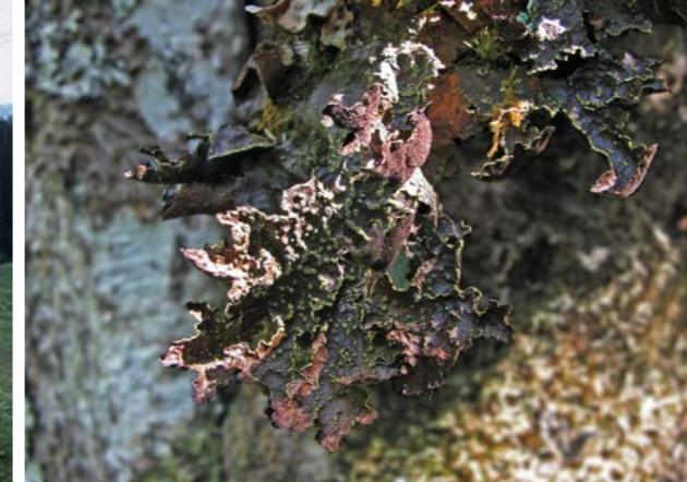
Gullprikklav ( Pseudocyphellaria crocata ). Flere interessante lavarter finnes her. Av spesiell interesse er rødlistearten gullprikklav. Dette er tilsynelatende en isolert utpost for arten som nærmest er kjent fra Hommelstø-distriktet i Brønnøy.