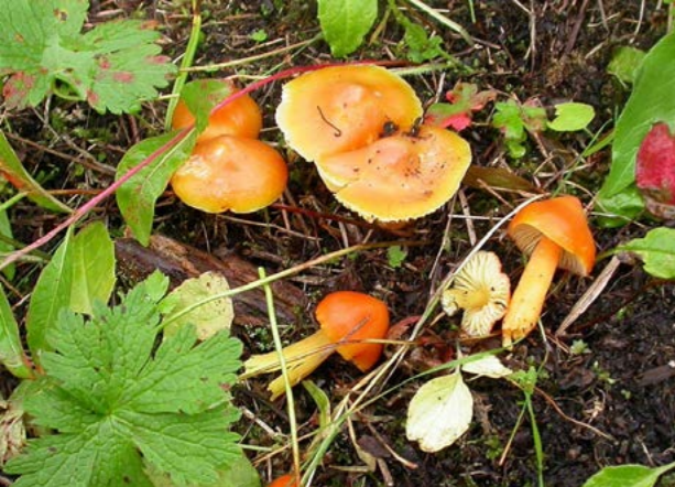
Cyllen vokssopp ( Hygrocybe aurantiosplendens ). Det mest interessante artsselementet i Nordre Varnvassdalen er knyttet til forekomsten av beitemarkssopp.