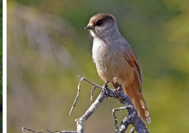
Lavskrike ( Perisoreus infaustus ). En del fuglearter er sterkt knyttet til barskogen, og flere av disse igjen foretrekker gammel og lite menneskepåvirket skog. I Varnvassdalen finner vi skogsfugler som f.eks. storfugl, tretåspett, varsler og lavskrike.