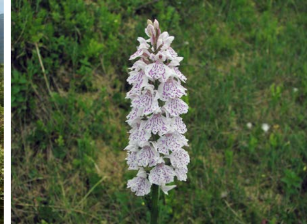
Flekkmariland ( Dactylorhiza maculata ). Blant plantene vi kan finne i Varnvassdalen naturreservat er bl.a. røsslyng, skrubbe, flekkmariland, myskegras, sølvbunke, myrhatt, svarttopp, kranskonvall og småmarimjelle karakteristiske innslag.