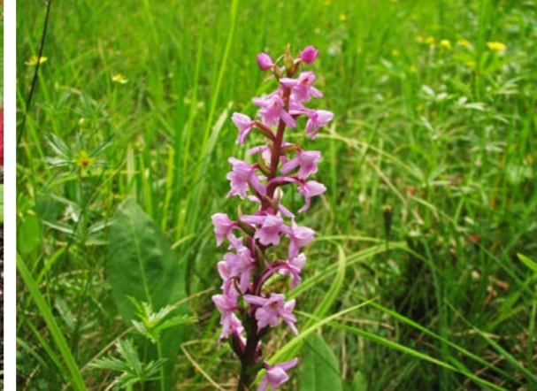
Brudespore ( Gymnadenia conopsea ). Nordre Varnvassdalen har en rik planteflora, og størst interesse har den engpregede og kalkrike bjørkeskogen i Famnlia med orkidéer som brudespore og stortveblad. Midten: Utsikt fra området rundt Hundtjøna over mot Varnvassdalen.