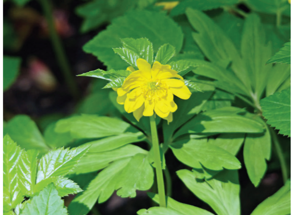
Gulveis. Midten: Ytre Klungset nedenfor jernbanelinjen.