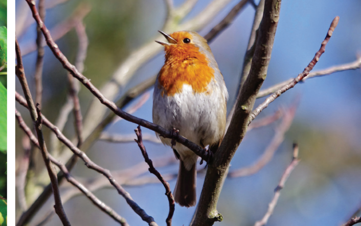
Rødstrupe. Også fuglelivet i den rike løvskogen er rikt og domineres av vanlige spurvefugler som trostefugler, sangere, meiser og finker.