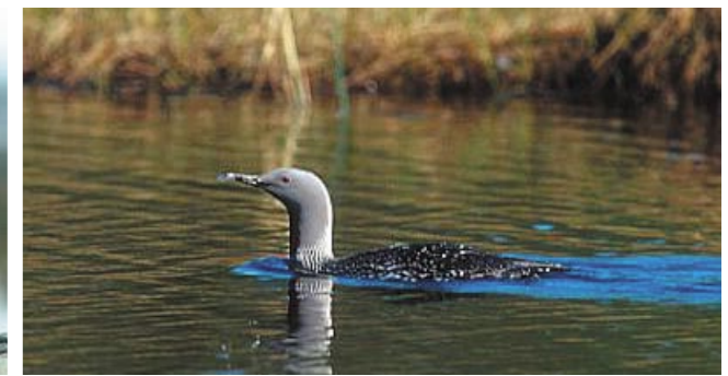
Flere par smålom som hekker i forbindelse med ferskvannsdammene inne på øyene i begge reservatene.