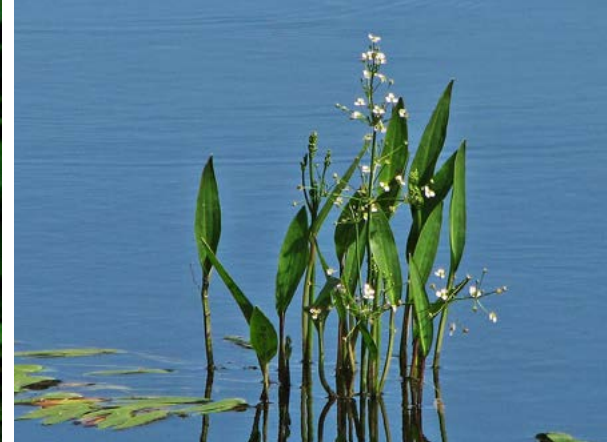
Vassgro ( Alisma plantago-aquatica )