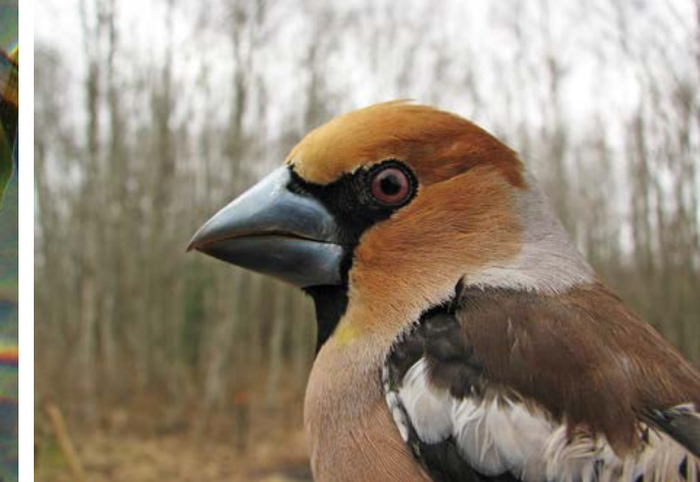
Kjernebiter ( Coccothraustes coccothraustes ). De trønderske flommarksskogene har også et meget rikt fugleliv, og har faktisk noen av de tetteste hekkebestandene av spurvefugler hele i verden!