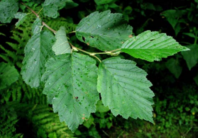
Gråor ( Alnus incana )