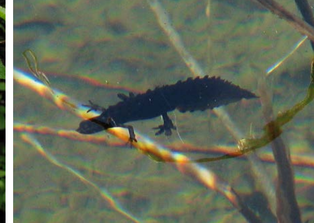
Småsalamander ( Lissotriton vulgaris )