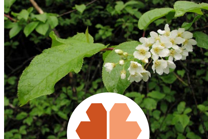
Hegg ( Prunus padus )