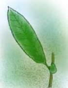
Mandelpil ( Salix triandra )

Norsk rødliste over arter og norsk rødliste over naturtyper beskriver arter og naturtyper som er trua av utryddelse, utsatt for betydelig reduksjon eller er naturlig sjeldne. Reppesleiret naturreservat har flere rødlistearter, både blant planter og dyr. www.artsdatabanken.no