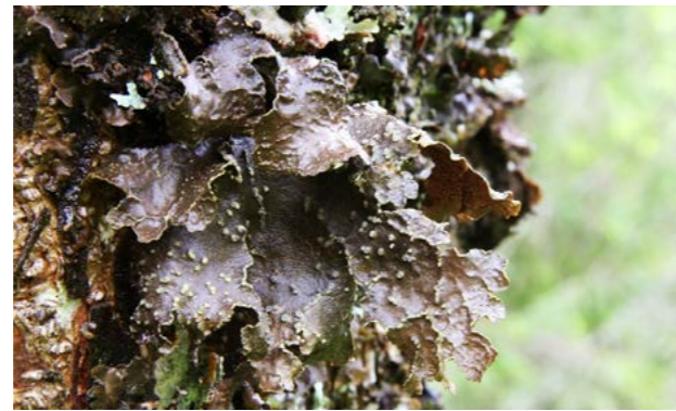
Den karakteristiske gullprikk-laven er også en rødlisteart, men er ikke så truet som granfjell-laven. Den er relativt vanlig i reservatet.