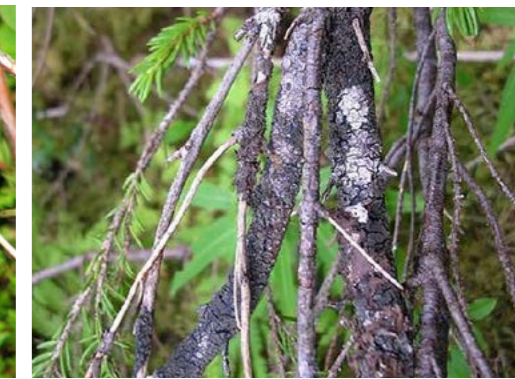
Granfjell-lav sammen med stiftfjell-lav og vrenge-lav. Granfjell-lav finnes kun i fuktig granskog langs Trøndelag- og Nordlandskysten. I løpet av de siste 60-70 år er 98 prosent av levestedene ødelagt av hogst! Ingen kjent lokalitet har så rik forekomst av granfjell-lav som Dølaelva naturreservat.