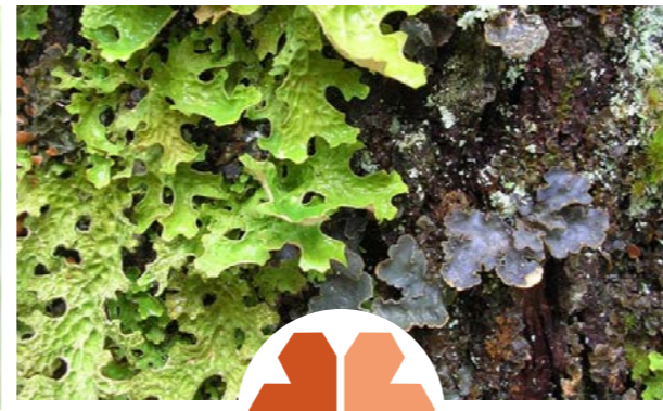
Lungenever (grønn) og skrubbenever (blå) er vanlige i reservatet.