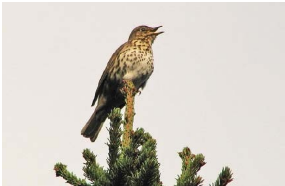
Sangfugler som bl.a. måltrost (bilde), rødvingetrost og svarttrost setter sitt preg på området om våren og sommeren.