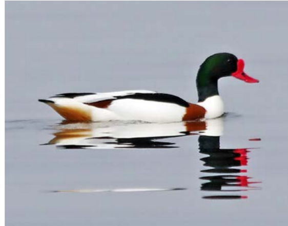
Gravand ( Tadorna tadorna )