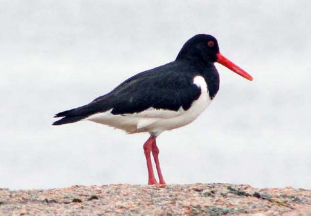
Tjeld ( Haematopus ostralegus )