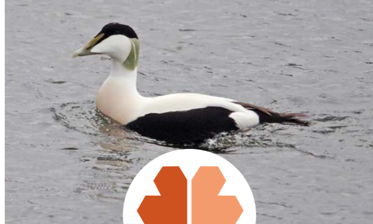
Ærfugl ( Somateria mollissima )