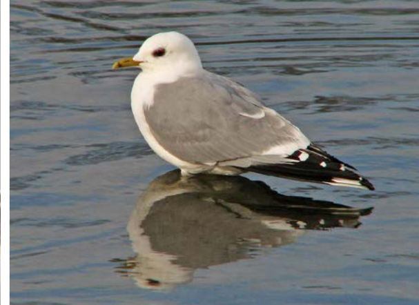
Fiskemåke ( Larus canus )