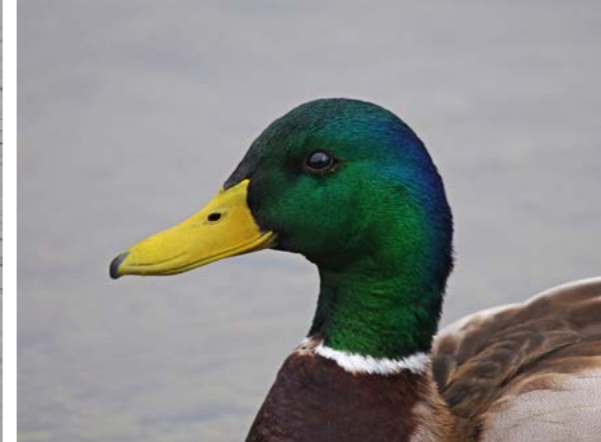
Stokkand ( Anas platyrhynchos )