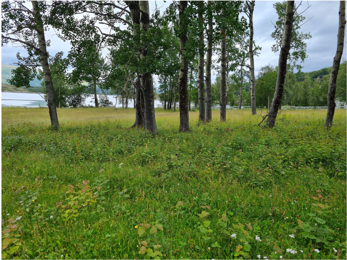
Figur 6. Årlig slått er et viktig tiltak i og rundt ospelunden for at årsskudd fra osp ikke kan etablerer seg og sprer seg videre inn i slåttemarka.