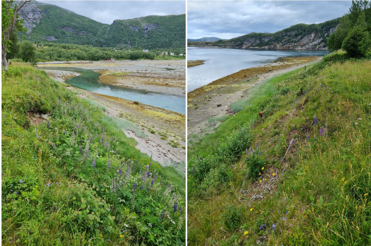
Figur 4. Skråningen mot sjøen på vestsiden av sättemarka har blitt ryddet og åpnet opp for kratt og trær de siste årene. Det er fremdeles en utfordring med lupiner som har spredd seg fra kirkegården og langs skråningen.