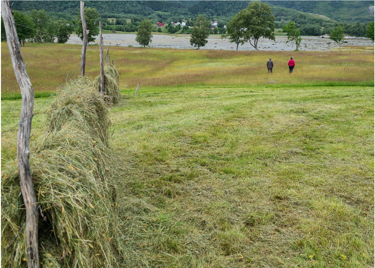
Figur 3. Den øvre delen av slåttemark i sørøst ble slått et par dager før befaringen og graset ble hesjet.