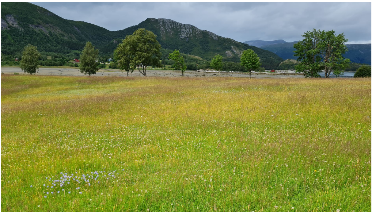
Figur 4. Slåttemarka har en fin og jevn struktur og artsfordeling.