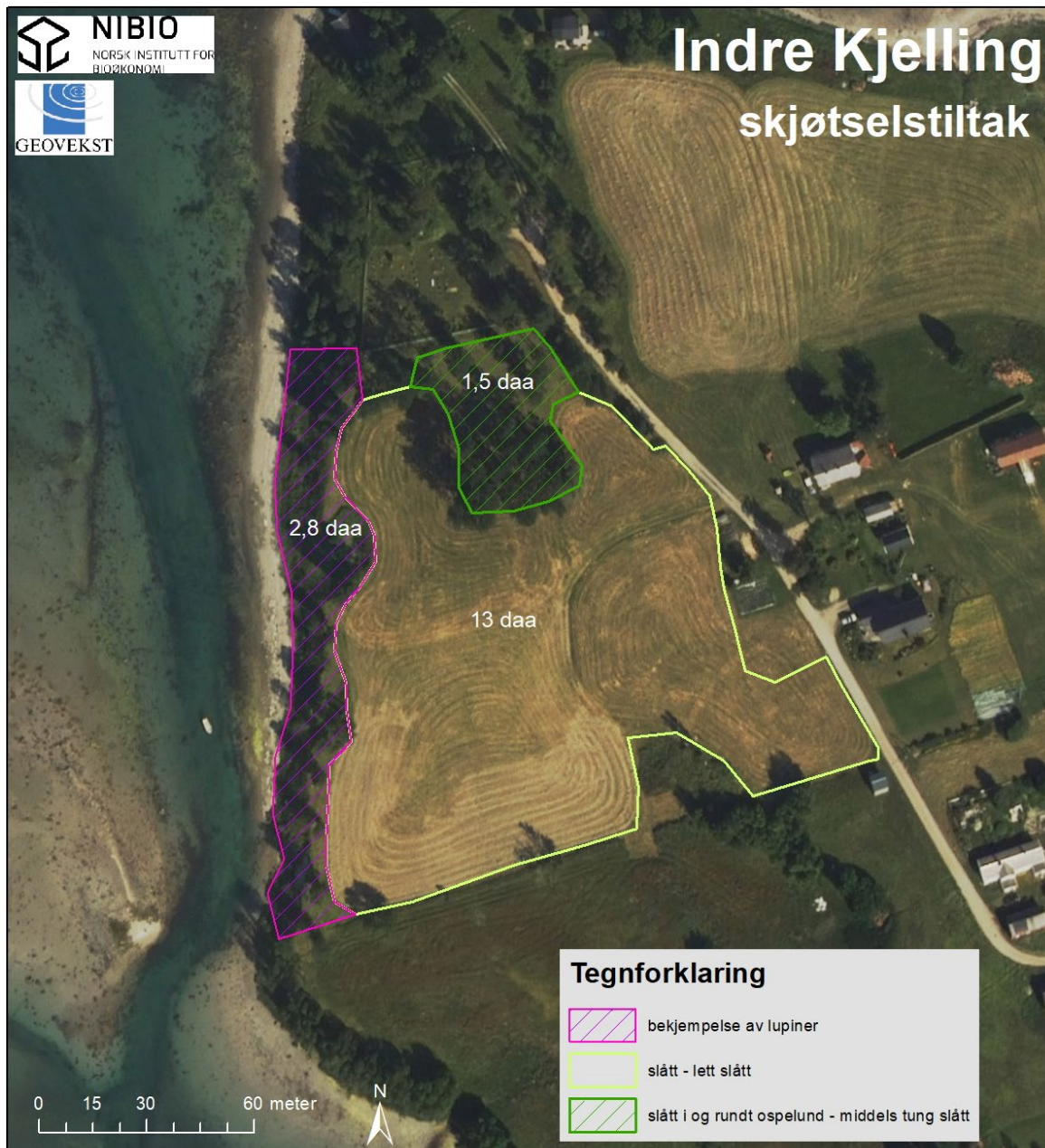
Figur 2. Oversikt over skjøtselstiltak som skal gjennomføres på Indre Kjelling.