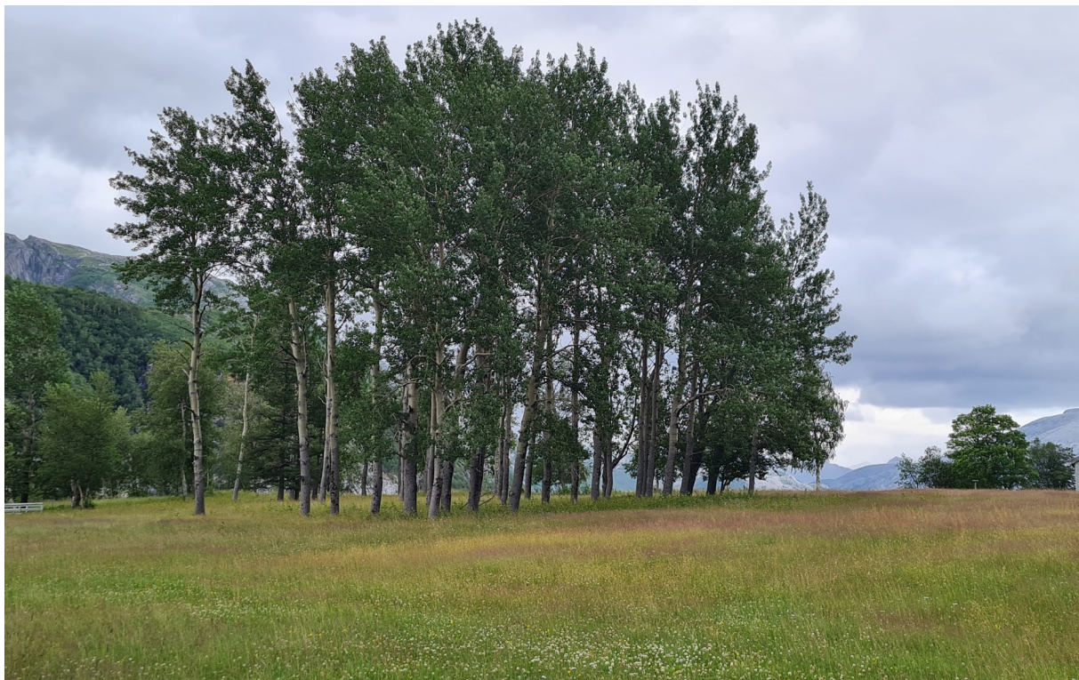
Figur 5. Ospelunden er åpen og feltsjiktet slås hvert år. De siste årene har vinden tatt en del av trærne.