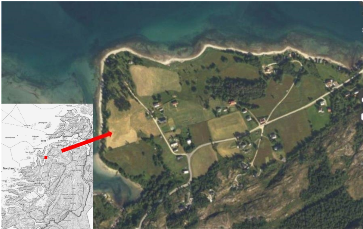
Figur 1. Oversiktskart som viser Salten-området i Nordland fylke og på flybildet vises lokaliteten «Unnlein» på Indre Kjelling.

Lokaliteten avgrenses mot vest av en bratt skråning ned mot sjøen, mot nord mot Kjelling kirkegård og en ospelund, og mot sør mot en annen eng. Mot øst avgrenses lokaliteten av veien til kirkegården.