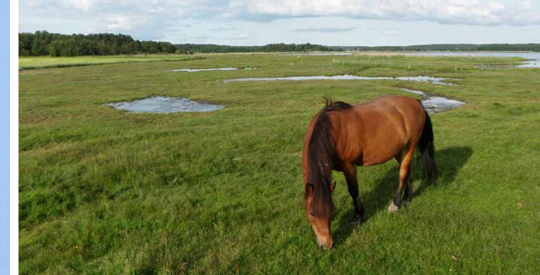
Beiting på Kure strand